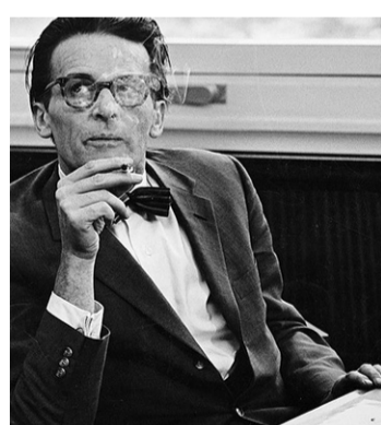
Charles mort ou vif.

Cinéma ► La Cinémathèque suisse à Lausanne présente au Festival de Locarno trois films restaurés, Charles mort ou vif d'Alain Tanner, Le Grand Soir de Francis Reusser et Grauzone de Fredi Murer.