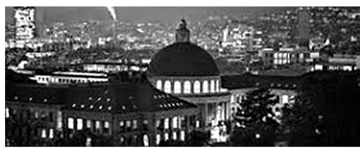
La bibliothèque de l'École polytechnique fédérale de Zurich.

Littérature ► Les dix plus grandes bibliothèques de Suisse abritent plus de 55 millions d'ouvrages. En 2018, 205 225 utilisateurs y ont emprunté 4,56 millions de livres, de journaux ou d'archives sonores. Ces chiffres ont été publiés mardi par l'Office fédéral de la statistique (OFS).